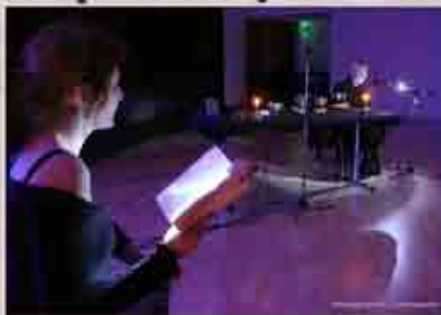
Le concert aura lieu demain 20 h 30 à la chapelle Ste Avoye

Avec bonheur, le spectateur, laissant à la porte idées reçues, références et préjugés, se laisse déstabiliser, investit des mondes inouïs, d'expression, de puissance. Elle parle maintenant une langue sortie de la gorge d'une femme Inuit. Quelle histoire nous raconte-t-elle, qu'il amplifie en frappant une haute marmite retournée ? Comme dans les or-