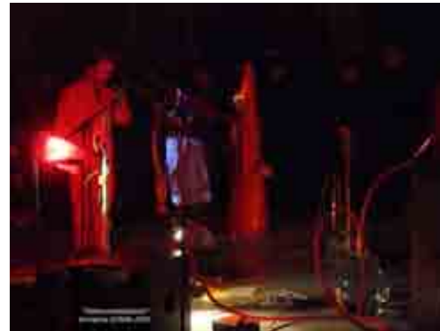
performance sonore à la menuiserie sarian

(*) extrais du texte de Alain MARCHAND Juin 2007. Fabrice Beslot, Fabrikdelabeslot